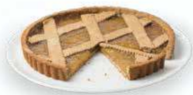
Immagine a scopo illustrativo